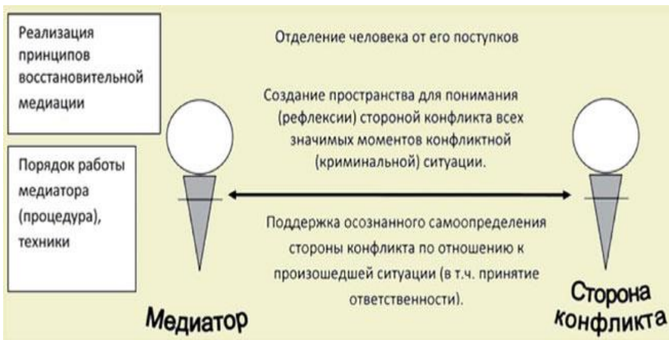
Рис 2. Позиция медиатора