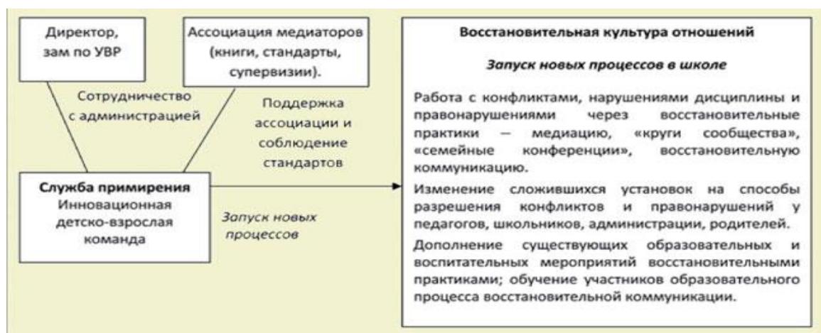
Рис. 5. Процессы, запускаемые службой примирения

Если директор принимает ценности и принципы службы примирения, считает это важной воспитательной практикой, то он готов ее развивать, понимая все связанные с этим риски (иногда и без поддержки «свыше»). Участие самого директора в тренинге и в медиации в случае конфликта позволяет школьникам и педагогам убедиться, что он действительно поддерживает службу примирения и принимает ее ценности.