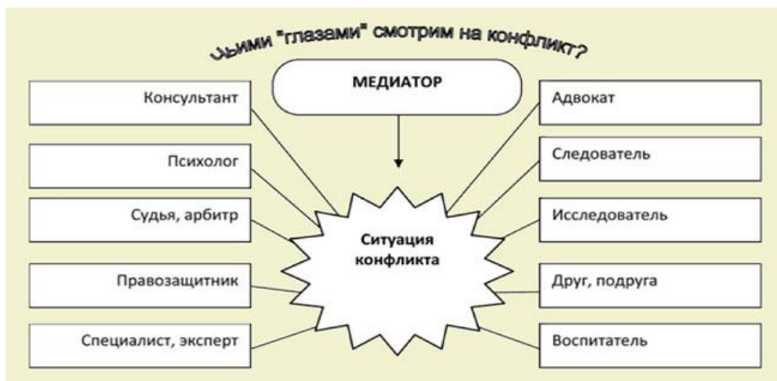
Рис. 3. Возможные «деформации» позиции медиатора

При потере позиции медиатор попадет в другие «роли» или другие профессиональные позиции (рис. 3), и тогда изменится его взгляд на ситуацию, а отсюда и способ разрешения конфликта и, соответственно, действия, то есть он уже перестанет быть медиатором.